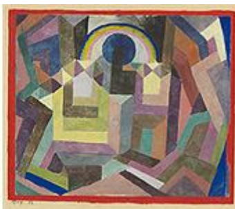
слева: Пауль Клее, Viento de la rosa (Ветер розы), 1922 г. справа: Пауль Клее, Mit dem Wind (С ветром), 1917 г