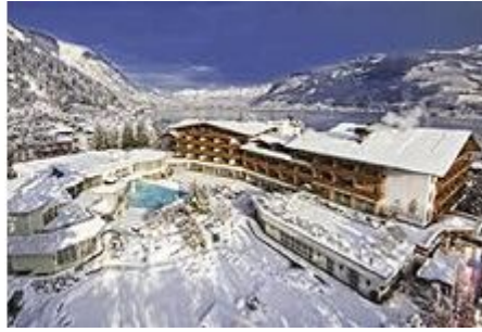
фотографии: гостиница «Salzburger Hof»