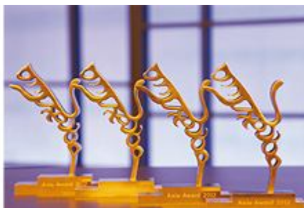
Премия «Ахiа» в 2012 году в Северном Рейне-Вестфалии

Премия «Ахiа» ежегодно присуждается аудиторской и консультационной компанией «Deloitte» средним предприятиям, которые с выдающимися результатами своей деятельности продолжительно успешно работают на рынке. Девиз премии этого года звучал: «Средние предприятия как двигатель экономического роста. Путь к успеху.» Премия присуждалась средним предприятиям, которые растут